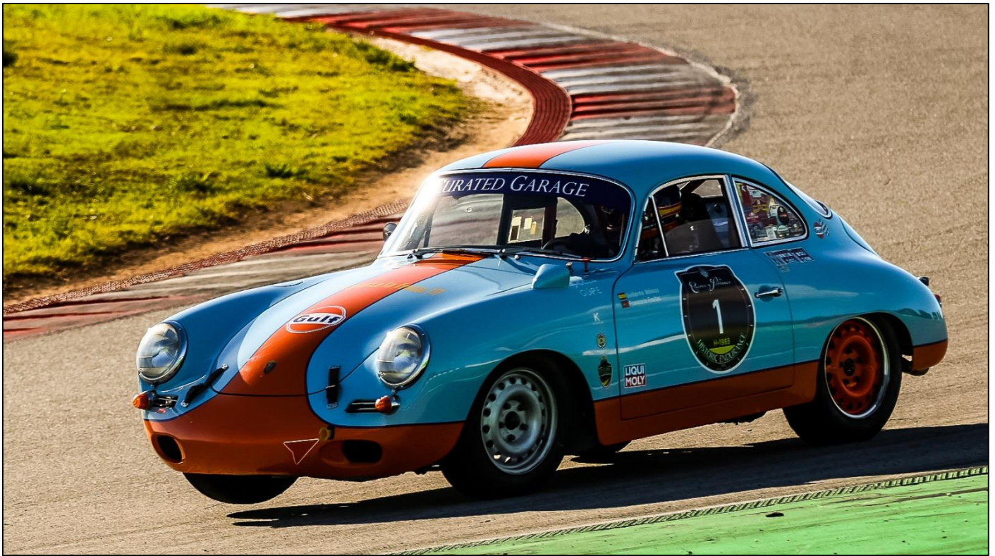
Guillermo Velasco - Porsche 356SC Gulf