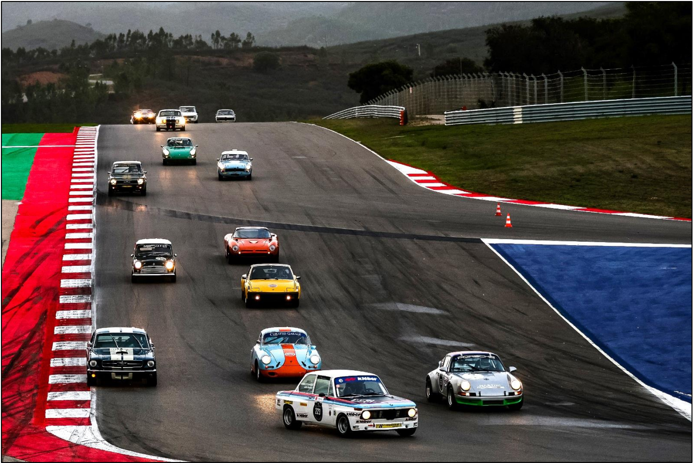
Guillermo Velasco (Porsche 356SC de Gulf) y Manuel de la Torre (Porsche 914/6), por el centro de la imagen