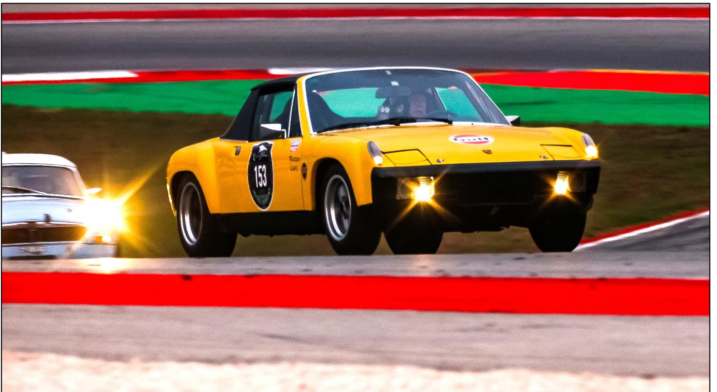
Manuel González de la Torre - Porsche 914/6